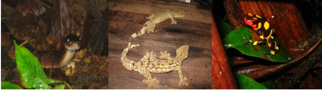
Fotos 1, 2 y 3 De izquierda a derecha: Lachesis muta (Viperidae), Tecdactylus rapicauda (Gekkonidae), Oophaga histrionica (Dendrobatidae).

Para el sector de Triana se encontraron las siguientes especies de anfibios y reptiles que se presentan en la gráfica No 5, incluida la especie Oophaga sp.